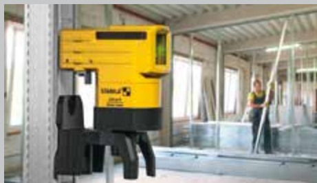
Potente sistema a magneti in terre rare