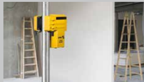
Dispositivo di bloccaggio integrato