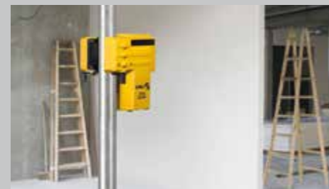
Встроенное зажимное приспособление