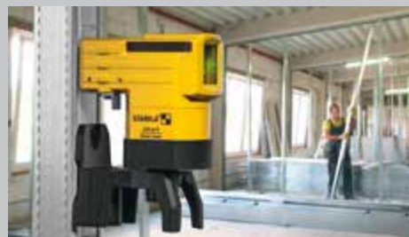
Мощные редкоземельные магниты